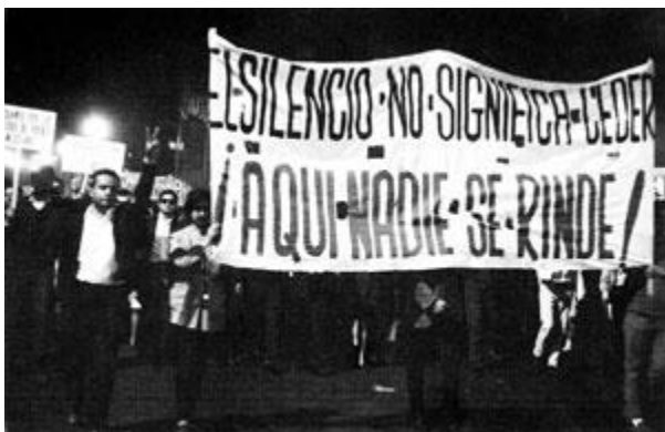
Primeras marchas después del bazukazo a la Preparatoria 1, julio 1968