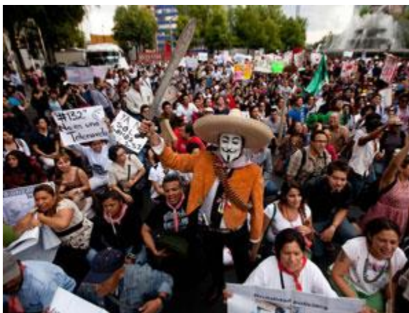
Ciudad de México, 2012.

Hoy los integrantes de #YoSoy132 tienen más poder de convocatoria que los muchachos del '68. A través de las redes sociales que jamás tuvieron en 1968, los estudiantes hoy llegan hasta Estados Unidos y Europa, a diferencia de los chavos del '68 que imprimían volantes en un mimeógrafo que podía escucharse toda la noche en un pasillo de la Facultad de Filosofía y Letras de Ciudad Universitaria. Los del '68 tenían una ventaja: no vivían acosados por la guerra del narcotráfico, no corrían el riesgo de que los cazaran como conejos a media calle, como ahora sucede en toda la República; los padres de familia no imaginaban que de la noche a la mañana los convertirían en víctimas, como en el caso del poeta Javier Sicilia y tantos otros.