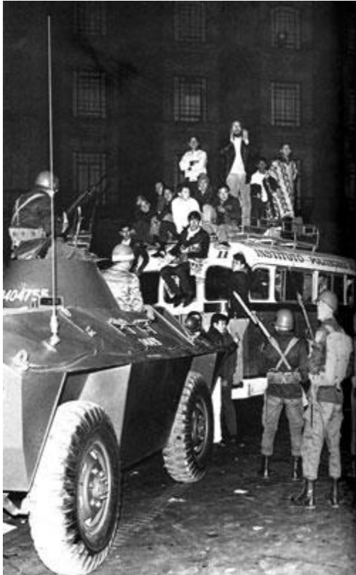
Fuerzas del Ejército desalojan del Zócalo a los estudiantes instalados en guardia permanente, 28 de agosto