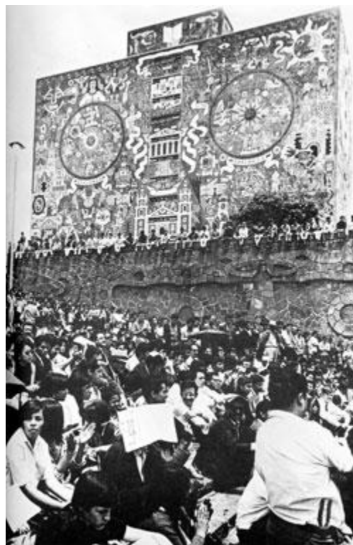
Asamblea en CU, posiblemente el 1 de agosto, al inicio de la Marcha por la Dignidad Universitaria