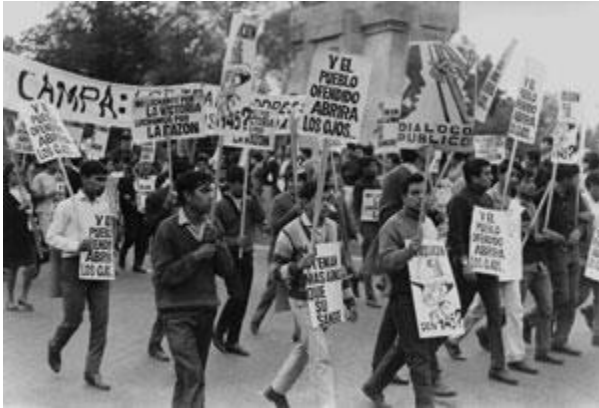
Ciudad de México, 1968

hospitalizó a más de 2 mil 500 entre niños, mujeres y ancianos. Las denuncias se silenciaron con la advertencia de la vuelta a la normalidad: “Está usted denigrando la imagen de México”, fue la forma de silenciar cualquier protesta, cualquier aclaración.