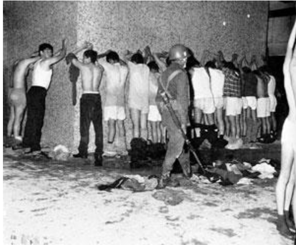
Detenidos en el edificio Chihuahua

Para desgracia del país, las autoridades son expertas en esconder la verdad, en cambiar las cifras a su favor, hacer trampa, mentir, y nunca sabremos cuántos murieron. Algunos jóvenes quisieron ponerse en los zapatos de los soldados y alegar que ellos sólo obedecían órdenes, para eso los entrenan, pero ¿quién se puso en los zapatos de los muertos? ¿Quiénes eran los dueños de los zapatos que quedaron tirados en la plaza, los de mujer, los de hombre, los de niño? ¿Quién podría tomar el lugar de los familiares angustiados por saber de sus hijos, esposos, hermanos? Le arrebataron la vida a muchos. “Los jóvenes pagaron con sangre su sed de justicia, pero ¿por qué tiene que ser tan cara si protestar y denunciar es un derecho de toda la humanidad?”, alega Manuela Garín.