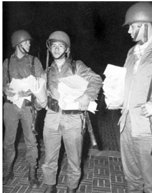
El Ejército en la Facultad de Filosofía y Letras de la UNAM